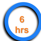
董監事上課平均時數

良好之董事會治理制度、完善的企業管理機制、健全的功能性委員會、運作以符合利害關係人期望。